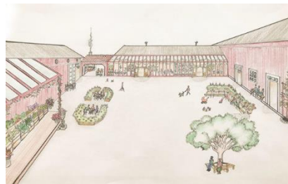
Visionsbild för Långbro gård.

Det finns många sidor med verktyg och arbetsmetoder för er som vill arbeta med lokala utvecklings-strategier. Vi vill tipsa om Hela Sverige Ska Levas verktyg " Landsbygd 2.0 " som är en bra grund för diskussion.